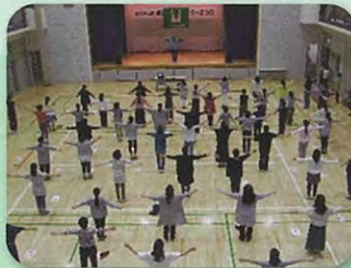
全員で正しいラジオ体操