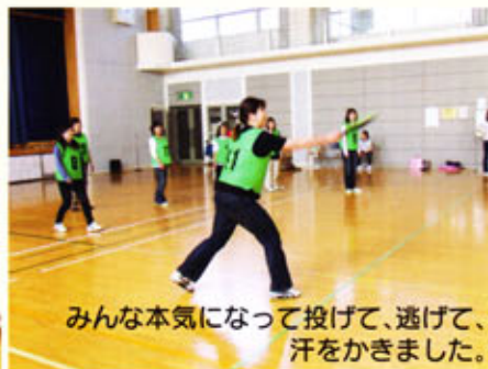
みんな本気になって投げて、逃げて、汗をかきました。