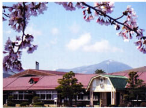
仙台唯一の木造校舎