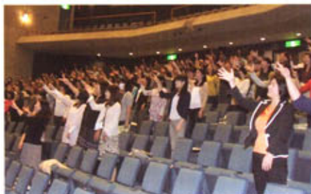
じゃんけんゲーム