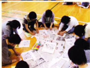
KYT (危険予知トレーニング)