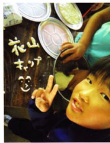
ピザの生地で文字づくり