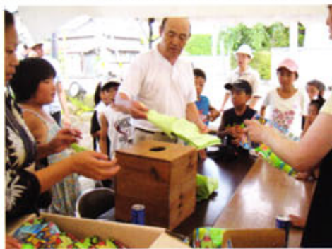
クイズラリーの様子